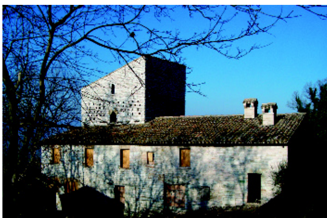
Vocabolo “La Maestà”: casa torre duecentesca.

A qualche chilometro dalla frazione di Smirra (m 231 s.l.m.), alle porte di Cagli , immersa nella campagna tra i vocaboli “La Maestà” e “Cacarota” si trova una casa torre chiamata “La Torre” o il “Palazzo” (m 423 s.l.m.). Qui, accolti dal gorgogliare di un fontanile, è possibile ammirare la costruzione medievale. Di proprietà privata, recentemente restaurata, presenta un piano terra ed un primo piano dal quale, verso sinistra, si distacca ancora una massiccia torre che, in passato, doveva essere un po’ più elevata. La casa è edificata in pietra calcarea locale, eter-