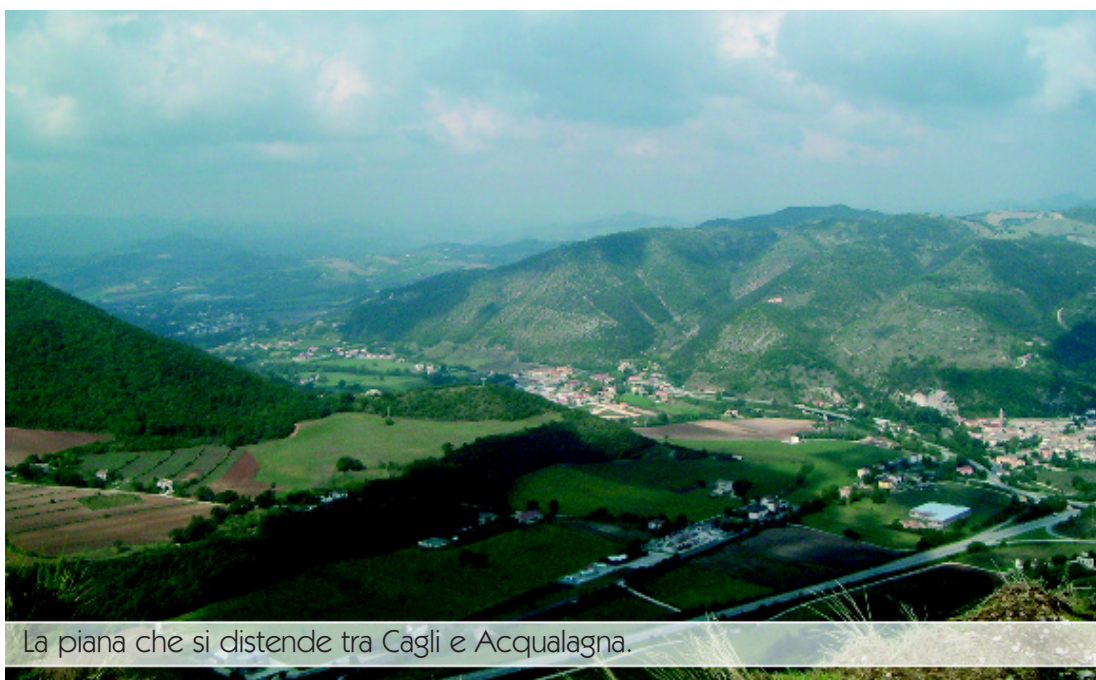
La piana che si distende tra Cagli e Acqualagna.