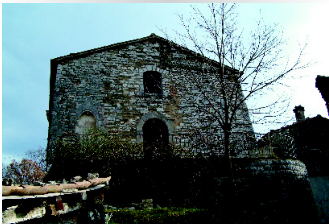
Abbadia di Massa, altro luogo di culto al quale i cagliesi sono molto devoti.