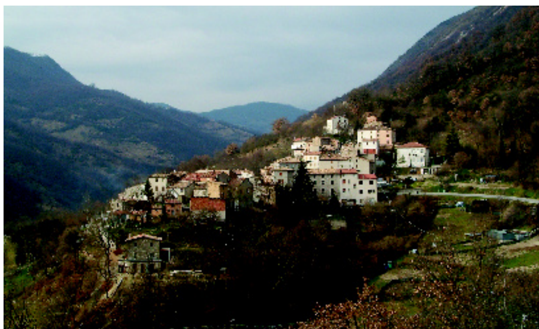
Il borgo di Massa.

Salendo per un breve, ma ripido sentiero, si notano, alla propria destra, i ruderi della struttura, immersi in una fitta vegetazione composta, per gran parte, da querce. Al culmine della salita si supera un dosso