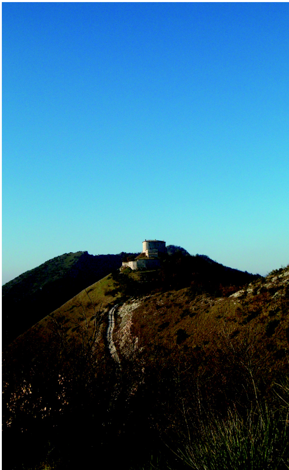
Il castello di Naro.