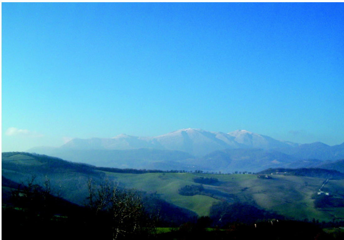
Veduta del territorio cagliese dalla via che conduce alla Maestà.

A qualche chilometro dalla frazione di Smirra (m 231 s.l.m.), alle porte di Cagli , immersa nella campagna tra i vocaboli “La Maestà” e “Cacarota” si trova una casa torre chiamata “La Torre” o il “Palazzo” (m 423 s.l.m.). Qui, accolti dal gorgogliare di un fontanile, è possibile ammirare la costruzione medievale. Di proprietà privata, recentemente restaurata, presenta un piano terra ed un primo piano dal quale, verso sinistra, si distacca ancora una massiccia torre che, in passato, doveva essere un po’ più elevata. La casa è edificata in pietra calcarea locale, eter-