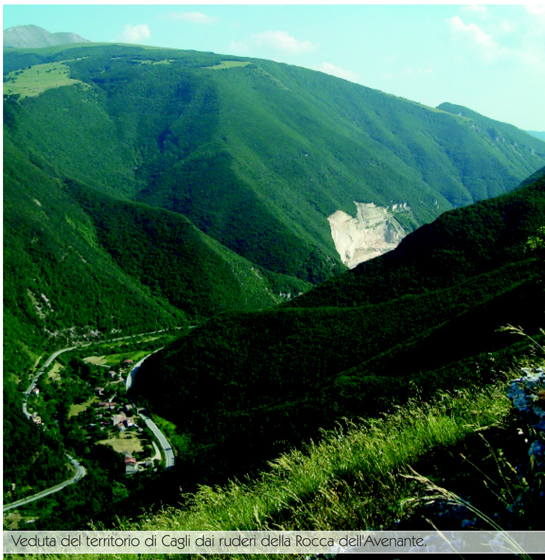
Veduta del territorio di Cagli dai ruderi della Rocca dell'Avenante.

In epoca protostorica, almeno quindici secoli prima di Cristo, la zona era già frequentata, ma il paesaggio era differente: le montagne, ma anche la pianura sottostante erano ricoperte da una fitta vegetazione.