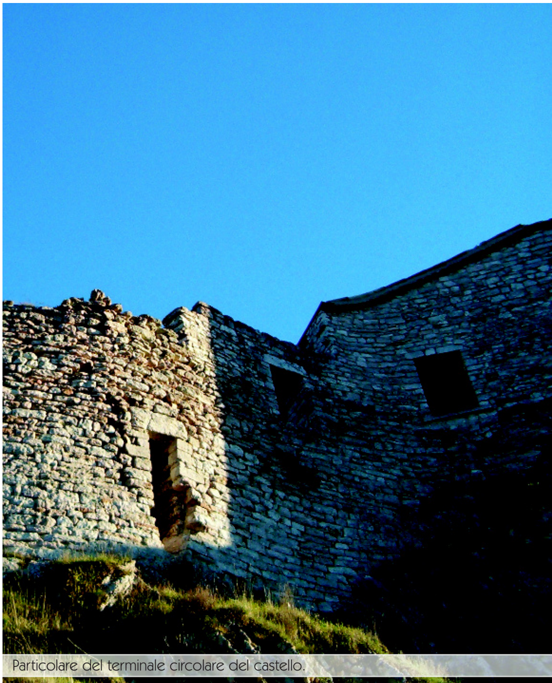
Particolare del terminale circolare del castello.

dette il castello per tutto il XIII secolo, fu poi controllato dalla potente famiglia dei Mastini per tutto il XV. Nel XVI secolo è annoverato tra i possedimenti dei Berardi e resterà di questa famiglia sino alla fine del XVIII secolo. Dal 1800 ad oggi diverse famiglie hanno posseduto questa fortificazione.