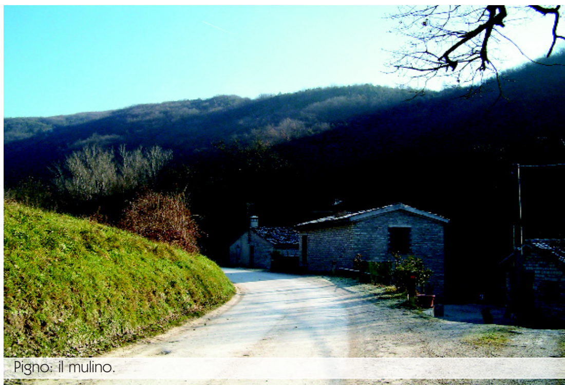
Pigno: il mulino.

Proseguendo verso il Monte Martello (m 501 s.l.m) ed il santuario di