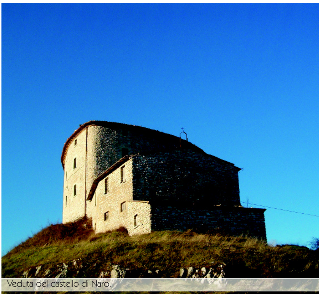
Veduta del castello di Naro.

E allora è bello immaginarselo così, il castello di Naro , nei primi decenni del XIII secolo, con qualche torre in più rispetto ad oggi, magari assediato dalle milizie del comune di Cagli , che rivendicano il possesso della costruzione. Le porte chiuse, le saracinesche abbassate, le guardie dietro gli spalti pronte a scoccare frecce o lanciare pietre e, vibranti