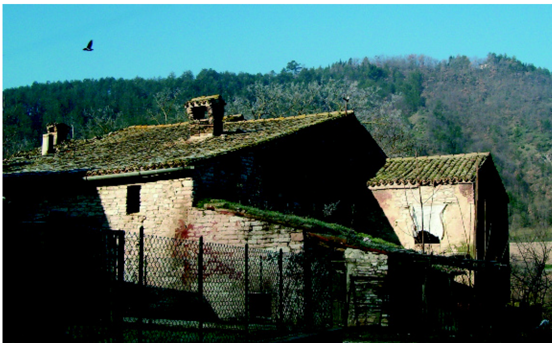
Pian di Donico, antica abitazione.

Tornando verso Smirra e attraversando l'antica via Flaminia si giunge a Pian di Donico (m 219 s.l.m.). Questo ombroso “piano vallivo” è situato sotto un alto monte che, sino al XIV secolo, sosteneva le strutture del castello di Donico del quale oggi restano importanti ruderi. Al centro della frazione è posta una grande e suggestiva casa in pietra che, secondo la tradizione locale, prima del secondo conflitto mondiale possedeva una torre, distrutta dalla violenza di un bombardamento.