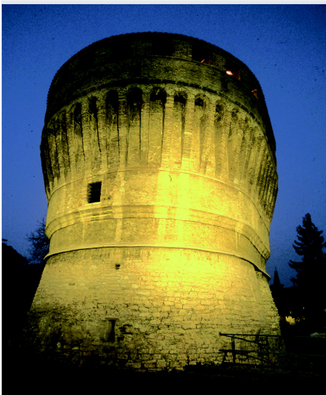
Cagli, torrione Martiniano, XV secolo.

Oggi, a prima vista, è difficile comprendere, purtroppo, l'essenza, il senso di questo torrione inghiottito nella frenesia del traffico, posto al centro di una piazzetta come il più sfortunato "addobbo di rotatoria". Fu innalzato qui, ad integrazione del circuito murario cittadino attorno al