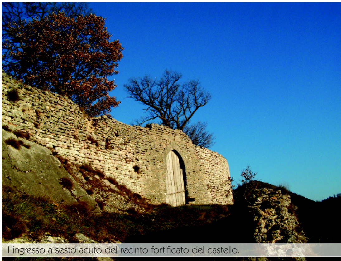
L'ingresso a sesto acuto del recinto fortificato del castello.

Si accede al corpo centrale della costruzione da un secondo portale ogivale. Nel castello è incluso un piccolo oratorio intitolato a Santa Caterina , riedificato nel corso del XX secolo. La famiglia Siccardi posse-