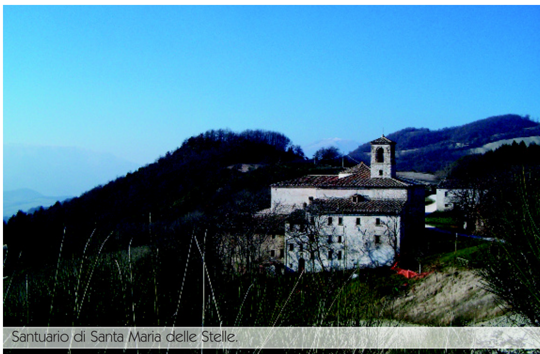
Santuario di Santa Maria delle Stelle.

Poco prima di raggiungere la chiesa, sulla sinistra, è presente una minuscola edicola votiva pitturata d’un tenue rosa; al suo interno è posta una statuetta della Vergine Maria , segnale importante e non casuale, un segnale che deve essere recepito. Forse svagati dal paesaggio e dall’allegro rincorrersi delle rondini (nei mesi che lo consentono) si dimentica che non si sta salendo ad una semplice chiesa o ad una blasonata abbazia, ma ad un santuario.