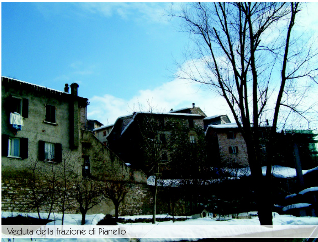
Veduta della frazione di Pianello.