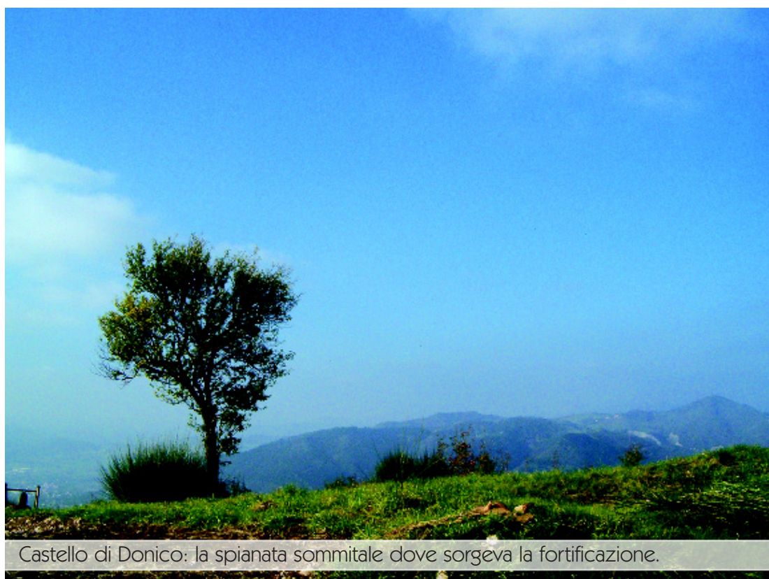
Castello di Donico: la spianata sommitale dove sorgeva la fortificazione.

damente dalla sottostante valle (chiamata Pian di Donico ), v'era il castello di Donico . La storia vuole che questo centro medievale sia stato distrutto nel XIV secolo dalle milizie del comune di Cagli , la sua immagine e leggenda resta in un acquerello del pesarese Francesco Mingucci dei primi del '600.