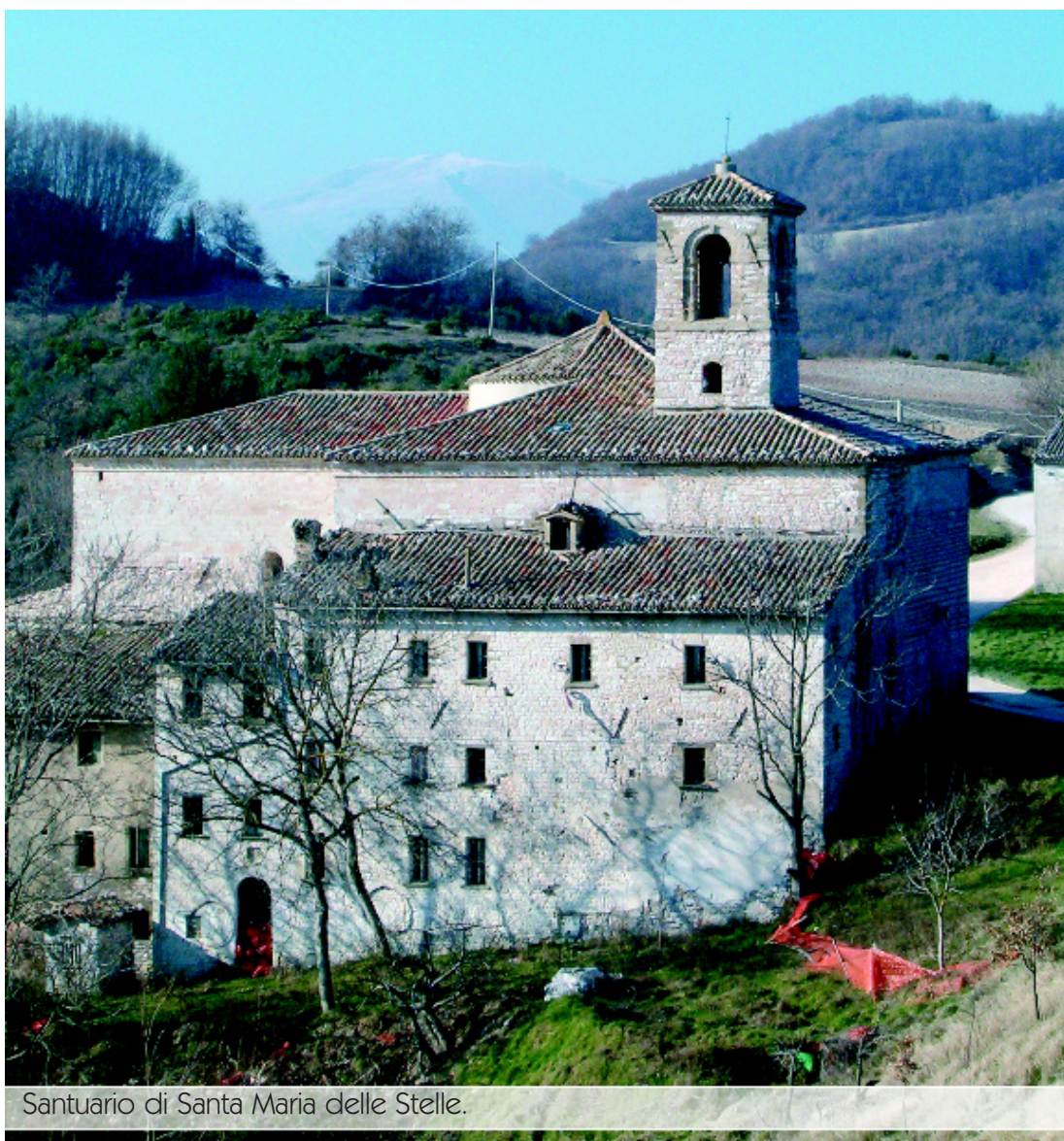
Santuario di Santa Maria delle Stelle.

Questa atmosfera antica e sacra si può ancora assaporare salendo al santuario di Santa Maria delle Stelle , complice la natura che ancora lo circonda, la strada bianca e il silenzio che stranamente oggi, diversamente da un tempo, avvolge la struttura e le campagne circostanti.