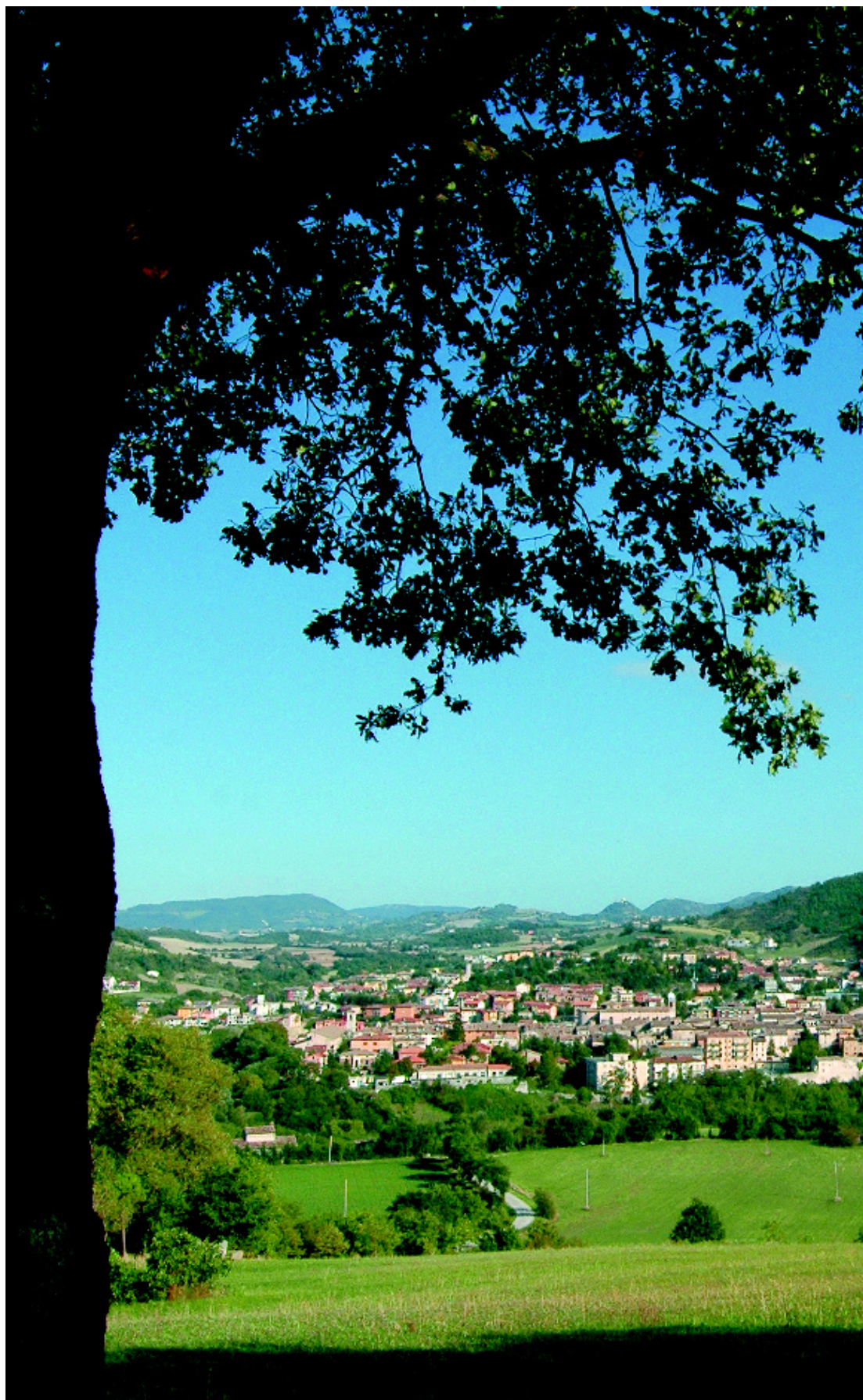
Veduta della Città di Cagliari