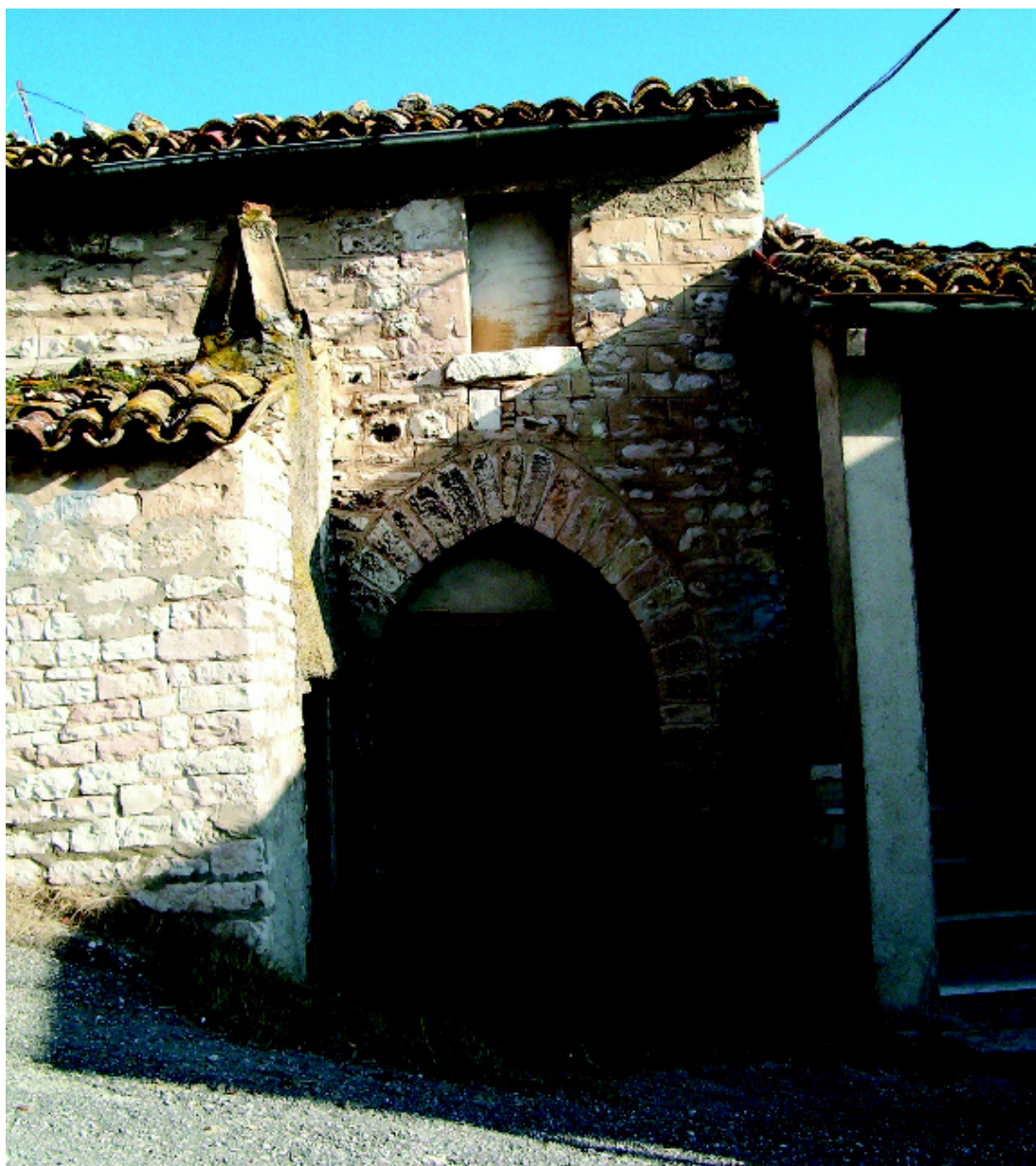
La Casella: portale gotico in pietra del Furlo.

Poco lontano da questa abitazione, in località “La Casella” (m 415 s.l.m.), dirimpetto alla pieve di San Martino e sotto lo sguardo vigile delle rovine di Castellonesto , un’abitazione conserva un minuscolo miracolo di arte. Appena raggiunta la frazione, subito sulla sinistra, scendendo per una corta discesa è visibile, alla propria sinistra, un’abitazione che, come ingresso, ostenta un sobrio portale a sesto acuto e, vicino al portale, un forno per la cottura del pane, indispensabile “accessorio” di ogni casa del passato.