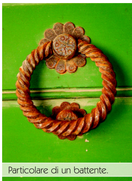
Particolare di un battente.

Vi sono altre case torri, sparse nelle campagne del comune di Cagli , al di fuori dell'itinerario proposto. Oltre a quelle presenti nella rinomata frazione di "Pianello" (m 386 s.l.m.), proprio sul colle posto di fronte alla frazione, oltre la Valle dei Mulini , tra il colle Peio (m 560 s.l.m.) e il colle di San Martino (m 603 s.l.m.) è situato un piccolo agglomerato di case dall'apparenza anonima ma che, al suo interno, nasconde diversi esempi, ancora intatti di