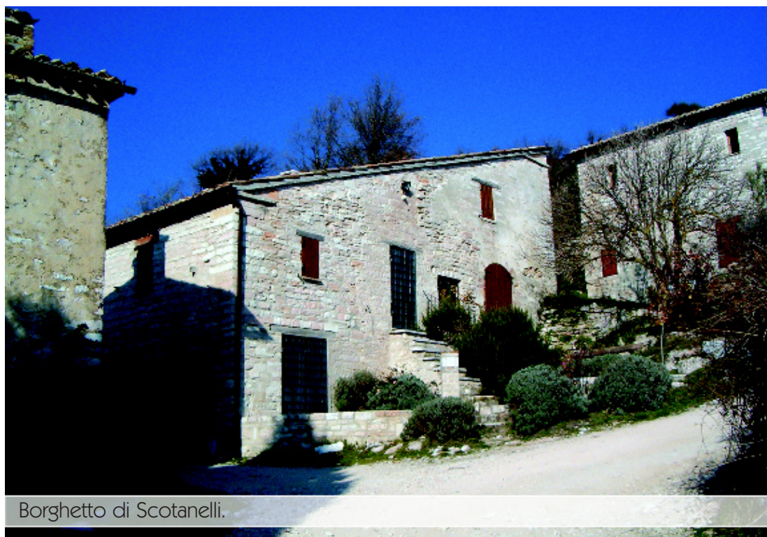
Borghetto di Scotanelli.

Il viaggio prosegue ancora per poco e, superata la chiesa di San Martino , termina alla frazione di Scotanelli (m 645 s.l.m.). Questa volta il borgo è quasi completamente restaurato, ma ciò non toglie fascino alla visita. Un sublime silenzio e, nel mese di giugno, il violetto profumo della lavanda accolgono chi sale su questo terrazzo collinare. Le poche abitazioni erano probabilmente tutte case torri, ma l'unica che resta è quella posta alla sinistra della strada d'accesso.