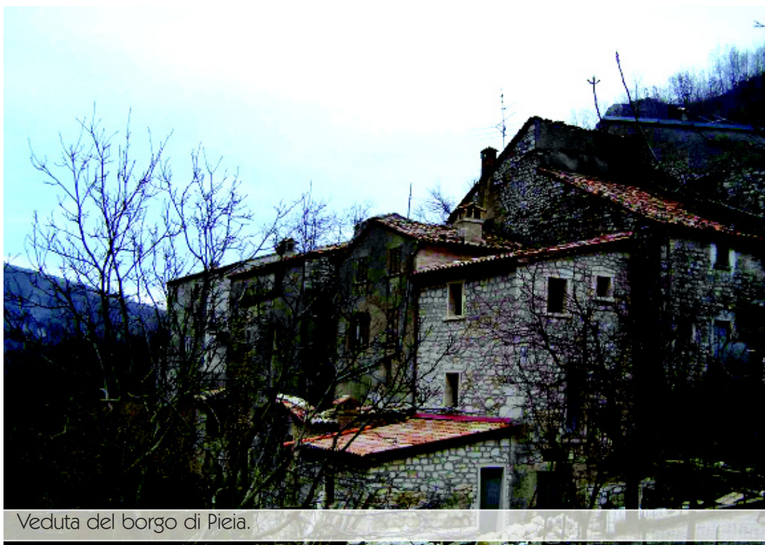
Veduta del borgo di Pieia.

Sempre attorno a Pianello nelle campagne di Massa , altro suggestivo borgo, precisamente nelle frazioni di Caiserra (m 563 s.l.m.) e Calacorgnola (m 530 s.l.m), esistono ancora rustiche abitazioni dal sapo-